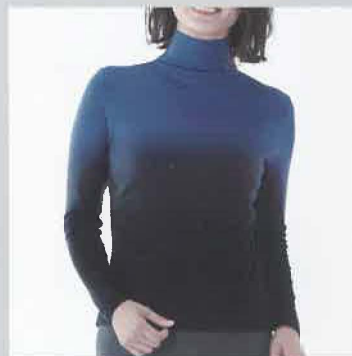
匠の染め職人エレガ ントグラデ WVG-11