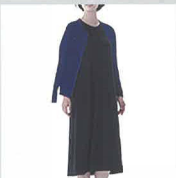
ショートカーディ WVG-32 新発売ワンピース WVG-36