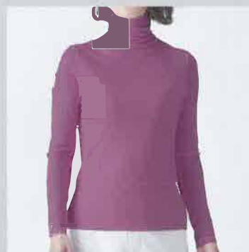
裾のステッチが無く スッキリ WVG-11