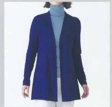
フェミニンなシルエ ットが新しい WVG-31