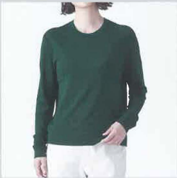
一重仕立てシンプル ロンTEE WVG-84

この素材を試験場で検査数値化した結果、ポリエステルやアクリルなどの合成繊維との差が明確になりました。保温力では合成繊維の1.5倍、機能性では消臭機能を証明、そして非常に毛玉が出来にくいという結果でした。エリッツウールでは優しく繊細なウール・ボイル・ガーゼ(WVG)が定番です。