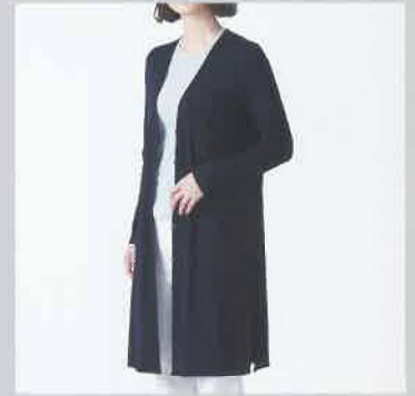
3シーズン活躍するロン グカーディー WVG-27