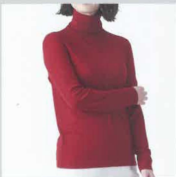
厳しい寒さの味方 全二重仕立 WVG-40