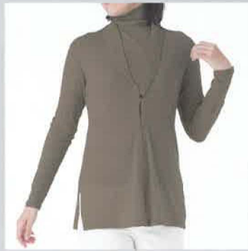
ショールカラーが エレガント。WVG-33